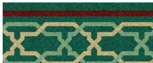
Fig 3 – Détail 2